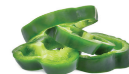
■ Aros hasta 2 unidades