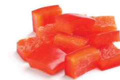
■ Dados para brochetas de 25 y 30 mm

La nueva unidad de vacío se puede colocar hasta a un máximo de 20 metros de la descorazonadora.