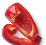
■ Trozos 2-24 unidades